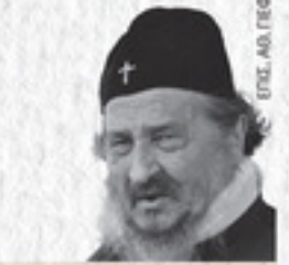
ΕΠΙΦ. ΑΘ. ΓΙΕΦΤΙΤΣ

▶ ΑΚΡΙΤΑΣ / ΑΦΙΕΡΩΜΑ ΣΤΟΝ ΜΑΚ. ΕΠΙΣΚΟΠΟ ΒΑΝΑΤΟΥ ΑΘΑΝΑΣΙΟ ΓΙΕΦΤΙΤΣ Φως Ιλαρόν, Όσιος Ιουστίνος Πόποβιτς, η ζωή και το έργο του, Ο άγιος Αθανάσιος ο Μέγας και η αλεξανδρινή σύνοδος του 362. ΟΜΙΛΗΤΕΣ: Ιωάννης Κουρεμπελής, Καθ. Τμήματος Θεολογίας Α.Π.Θ, Διονύσιος Σκλήρης, Δρ Ελληνικών Σπουδών, Αρχιμανδρίτης Andrej Sajc, Ηγούμενος του μοναστηριού Crna Reka. Συντονισμός: Μαρία Κοκκίνου, Εκδότρια